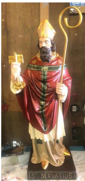
Het opgeknapte beeld.