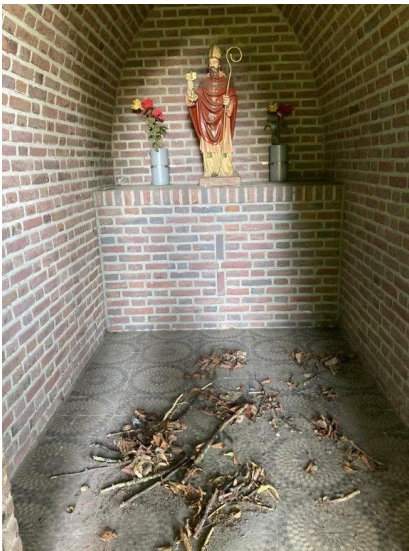
De oude situatie.

Om de duistere kapel wat lichter te maken werd de achterwand wit geschilderd en van ornamenten voorzien. Het Servaasbeeld kon vakkundig onder handen worden en kreeg daardoor een nieuwe verflaag. Het poorthek kon naar het straalbedrijf in Asten gebracht worden om daar te worden gezandstraald, geschoopt en voorzien van een coating in de RAL-kleur 7033, zacht loofgroen. Deze kleur oogt vriendelijker dan de oorspronkelijke zwarte verflaag. Ook de vloer en het tafelblad kregen een flinke beurt, zodat de mooie tegels weer duidelijk te zien zijn. Het opnieuw bevestigen van het poorthek was nog een hele klus, maar lukte uiteindelijk wel. Eigenlijk jammer dat zo'n hek nodig is om ons erfgoed te beschermen. Het informatiebordje is niet meer bevestigd omdat het de bedoeling is om alle kruisen en kapellen van nieuwe informatieborden te voorzien. De Werkgroep Kruisen en Kapellen kijkt in ieder geval weer met plezier terug op dit project. Op naar het volgende.