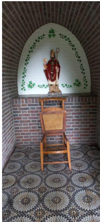
De nieuwe situatie.