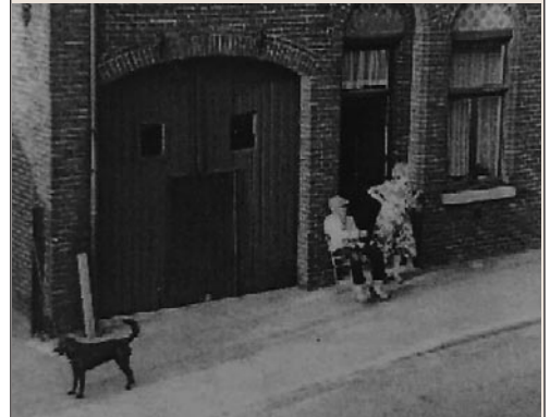
Coxe Sjengske en de vrouw vur 't hoeës.

det de aannemersbond eine kier per jaor of zoeë d'r op oet ging. Doa waas ozze pap auch bej dae zekere kier. De reis ging Duitsland in. Mer naodet ze 'ne hiele tieëd in de bus gezaete haaie, woord 't hoeëg tieëd um te aete. De mansluu koste good aete en verginge van d'n honger. Normaal waas 't mierendeil gewend um 'n flies mit botteramme nog veur de middig te verorbere. D'r woord gestopt bej 'n sjiek restaurant. Det waas veur de meiste al iets um 't van op de lachspiere te kriege. Afijn, ze ginge aan 'n lange sjoëen gedekte taofel zitte en toen begos 't lange wachte. Zoeë wie det normaal is in zon gelegenheid. Dao leep auch nog zonne ober mit 'ne witte handdook over d'n erm, maar det aete leet steeds langer op zich wachte... totdet Coxe Sjengske 't meug waas. Hae stong op en reep: "WAO BLIEVE VERDOMME DIE PETATTE?" 't Zal daonao wel neet lang mier gedoord hebbe, want bej 't gezelschap waas d'n baer los!