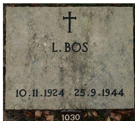
De grafsteen op het Ereveld in Loenen.

Bronnen: Oorlogsgravenstichting Archief Heemkundevereniging Helden