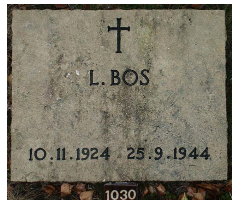
De grafsteen op het Ereveld in Loenen.