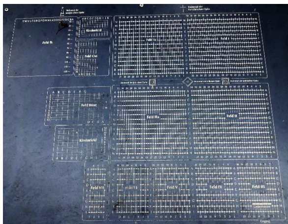
De plattegrond van het kerkhof Jammertal.