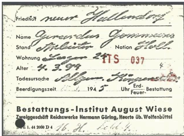
Het document van de begrafenisondernemer in Hallendorf.

Graed of Chrit wordt ook het slachtoffer van de kerkrassia en komt daardoor in Duitsland terecht. Volgens de papieren is hij vanaf 17 oktober 1944 tewerkgesteld bij de Reichswerke Hermann Göring in Salzgitter als 'verlader' en verblijft in Reppner Lager 24. Daar sterft hij door 'Allgemeine Körperschwäche', zoals dat in de papieren aldaar vermeld werd. Hij wordt begraven op het kerkhof van Hallendorf veld 4 rij H graf 16, maar herbegraven op het grote kerkhof Jammertal in Salzgitter.