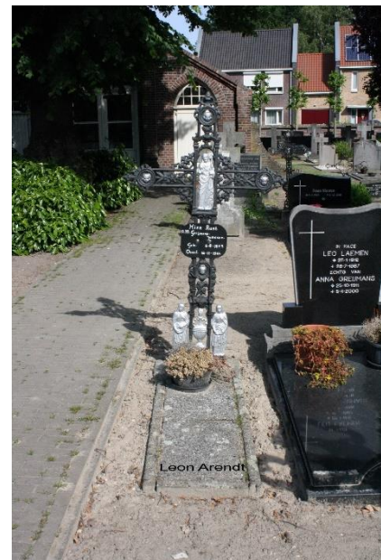
Gezamenlijk bidprentje en het graf op het kerkhof in Panningen.