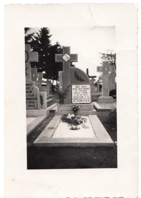
Het graf van Willy.