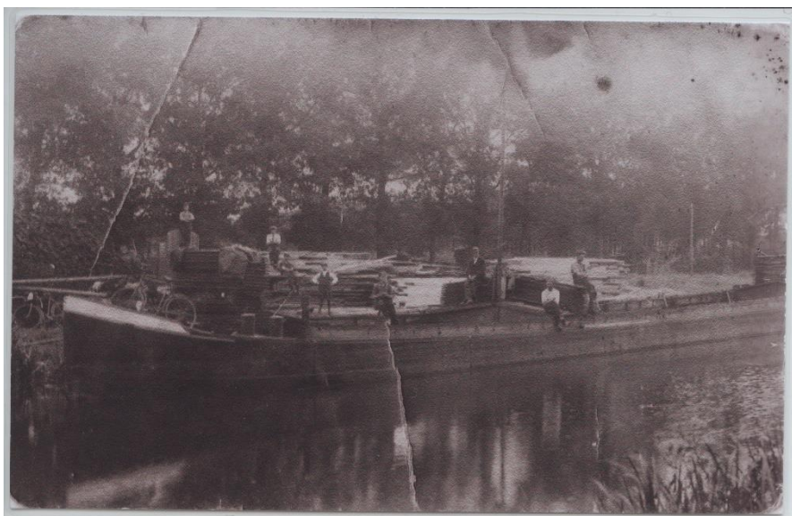
Zijn schip De Hoop.