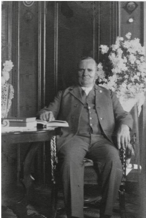
Een statige foto.